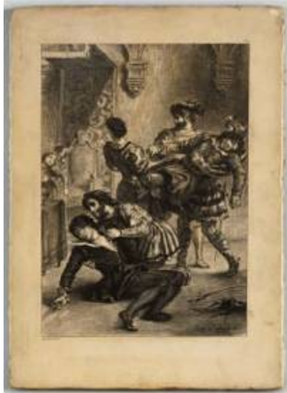
La mort d'Hamlet après le duel

Musée Delacroix, RMN Grand Palais (Musée du Louvre), René-Gabriel Ojéda